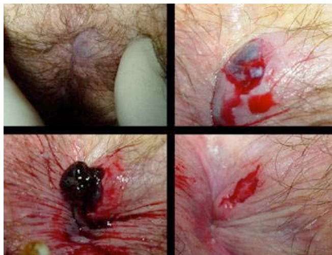
insnede van een anale trombose

Meestal zal echter toch gekozen worden voor een operatieve ingreep. De perianaal trombose kan worden ingesneden en het gestolde bloed kan worden verwijderd. Deze ingreep onder lokale verdoving geeft een onmiddellijke verlichting van de pijn. Een volledige operatieve verwijdering van de perianaal trombose geeft de beste resultaten op langere termijn.