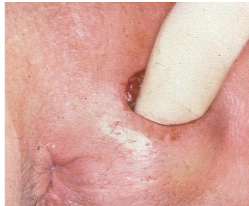
drainage van een perianaal abces